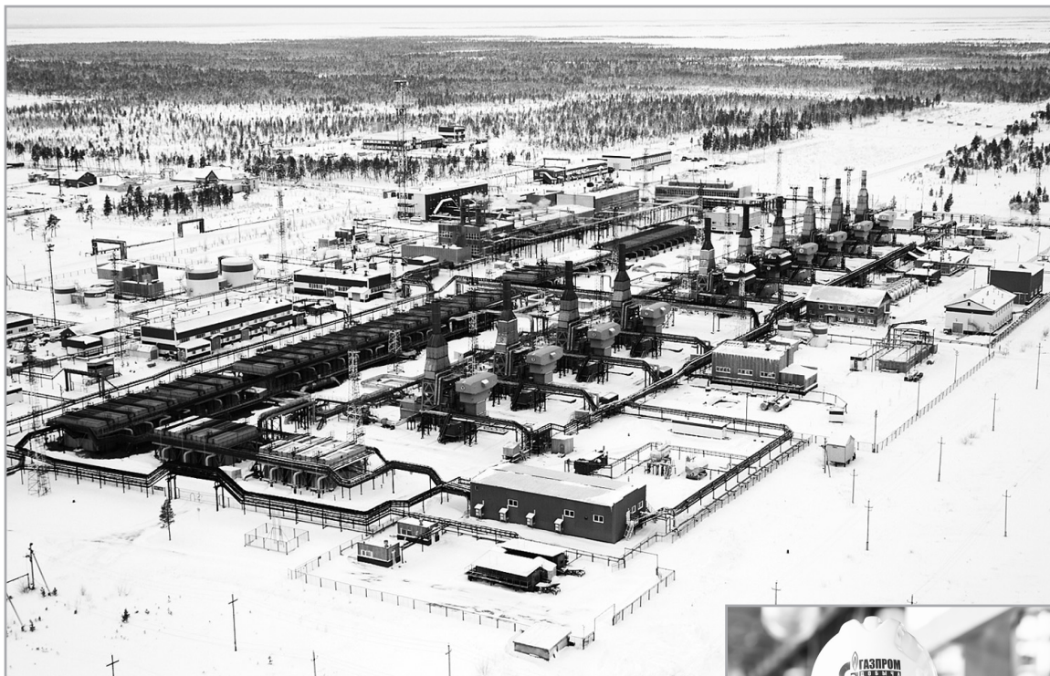
Губкинский газовый промысел с высоты птичьего полета.

Операторские услуги, оказываемые ООО "Газпром добыча Ноябрьск" независимым недропользователям, составляют весомую часть производственно-экономических показателей предприятия. Из 59,4 млрд кубометров газа, которые ноябрьские газовики планируют добыть в 2015 году, на долю инжиниринговых и операторских услуг приходится 21,2 млрд, то есть 35,6%.