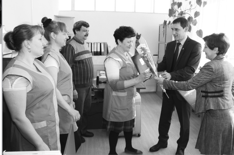
Награждение работников бытового обслуживания населения и жилищно-коммунального хозяйства города Губкинского.

– Несмотря на сложные экономические условия нам удается сохранять наш работоспособный коллектив. Это самое главное. Во-вто-